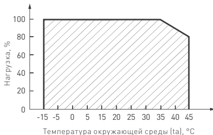
Рис. 2. Максимальная допустимая нагрузка, % от мощности источника.