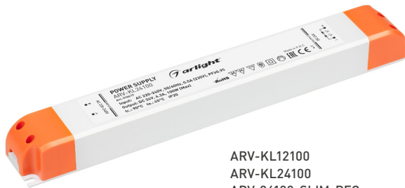
ARV-KL12100 ARV-KL24100 ARV-24100-SLIM-PFC