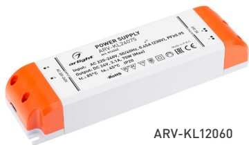
ARV-KL12060 ARV-KL24060 ARV-KL12075 ARV-12075-PFC ARV-KL24075